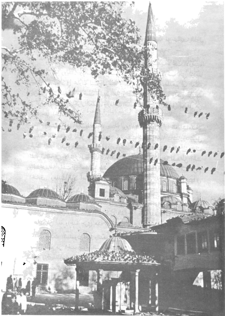
جامع أبي أيوب الأنصاري في اسطنبول. أقيم في المكان الذي اكتشف فيه قبر الصحابي الجليل رضي الله