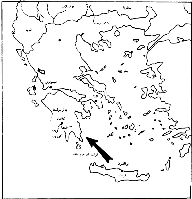
الثورة اليونانية وحملة ابراهيم باشا.