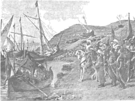
رسم يوضح كيفية نقل السفن فوق البر اثناء فتح القسطنطينية.