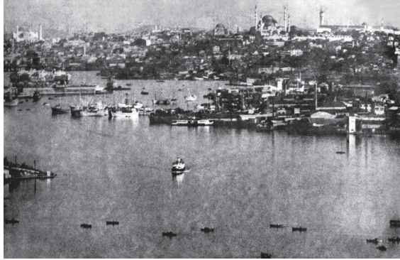
هذه صورة القسطنطينية مع بوغاز البوسفور.

وأرضها آخذت بالارتفاع شيئاً فشيئاً من الخليج المذكور إلى الداخل، وأما بحر مرمرا فإن بوغاز الدردانيل يصله ببحر جزائر الروم والبحر المتوسط، ولكن يفصلها عن آسيا مضيق من البحر عرضه نحو ميل أو ميل ونصف، وهو معروف بالبوغاز المذكور، وهي قائمة على سبعة تلال من أطراف أوروبا، كائنة على لسان في البحر، وهذا اللسان على شكل مثلث الزوايا، موقعه على الطرف أو الشاطئ الغربي من مدخل البوغاز الجنوبي المذكور الذي يقال له البوسفور، وكان يسمى قبلاً بوسفور طراشيا، والبوسفور: لفظة يونانية معناها ممرٌ — أو طريق — الثور، كما كان يزعم قومٌ أنه كان ممر الثور، وهذا اللسان هو داخل بين البحر الأسود وبحر جزائر الروم، وفي الجانب الشمالي من المدينة جدولٌ أو فرعٌ من البوغاز يُدعى القرن الذهبي، وهو المعروف بالميناء الرائقة المنظر؛ لحسن كيانها، وهي تفصل البيرا أي بك أوغلي عن القسطنطينية، أو كما قال بعضهم أيضاً إنها واقعة على مدخل جنوبي الغربي من البوسفور على شبه جزيرة مثلثة الزوايا، جاعلة القرن الذهبي — أي ميناء القسطنطينية — على ممر من البحر وبحر مرمرا.