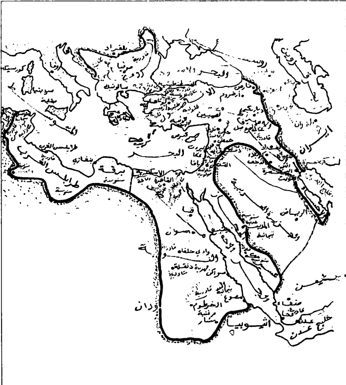
رسم الخريطة نقلاً عن كتاب لوتسكي - تاريخ الأقطار العربية الحديث.

حدود الإمبراطورية العثمانية في أواسط القرن التاسع عشر