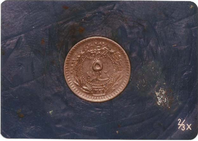
18- صورہ لوجہ قطعہ (5) بارات المعدنيہ العثمانيہ، وتساوي (1/8) من الغرش الورقي.