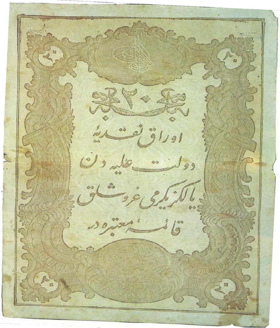
3- صورہ لوجہ ورقۃ النقد العثمانیۃ (نظام القائمة) والتي صدرت فی عهد السلطان عبد العزیز، بقيمة (20) غرش.