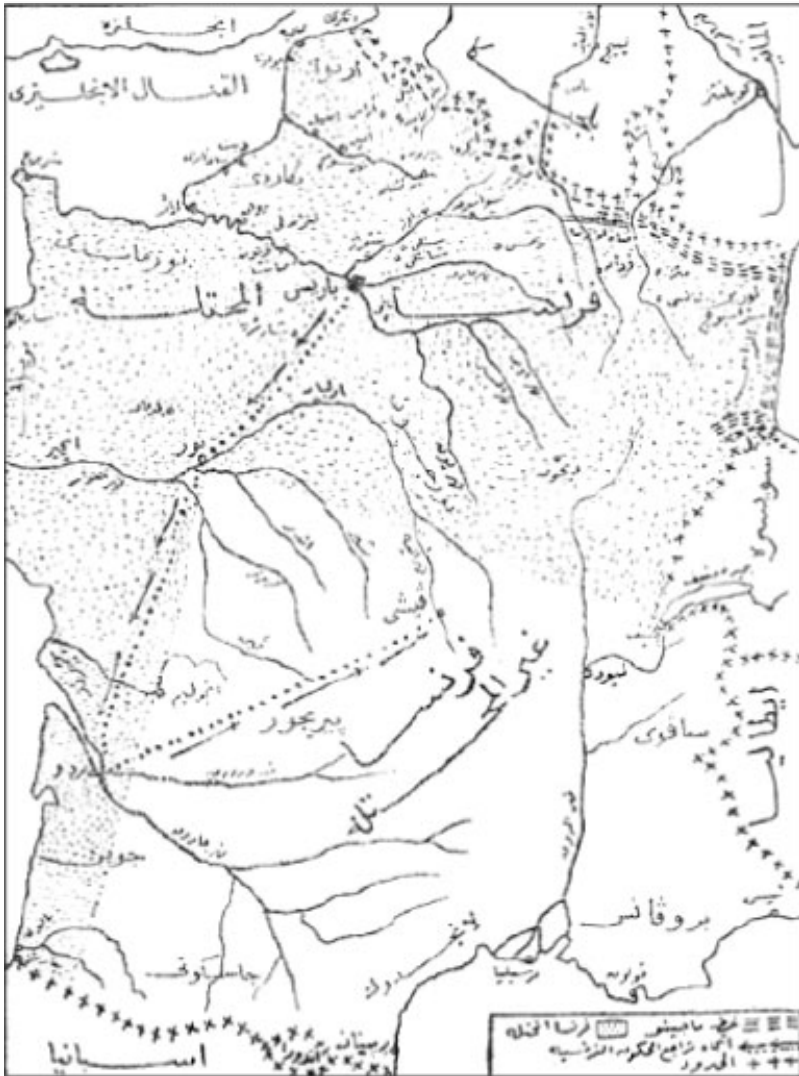
خريطة فرنسا في يونية سنة ١٩٤٠م