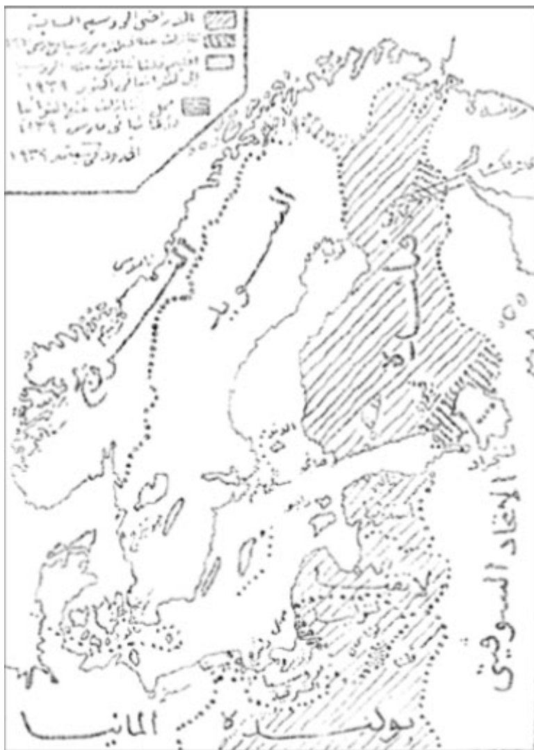
إسكندنافيا وفنلندا ودول البلطيق.