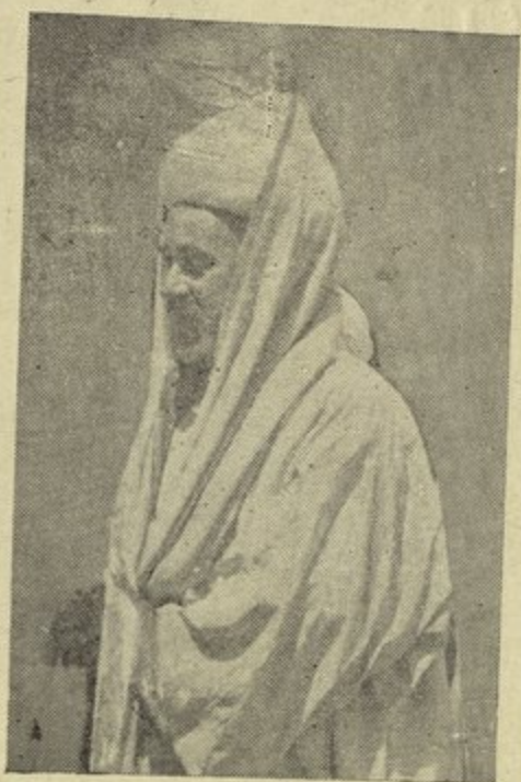
صورة صاحب الفضيلة والسماحة الاستاذ الاكبر مولانا سيدي احمد بيرم شيخ الاسلام بالديار التونسية اخذت من احد المواكب ابقاه الله ومتع به الاسلام