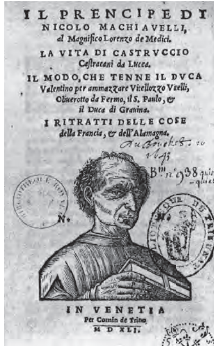
شكل ٢-١: صفحة العنوان لواحدة من الطبقات الفينيسية الأولى لكتاب «الأمير».

المرتبة على استمرار التدخلات الفرنسية والإسبانية في إيطاليا، وبعد ذلك — كما أوضح في رسالة له بتاريخ العاشر من ديسمبر — بدأ يشغل فراغه القسري بأن يتفكّر على نحو أكثر منهجية في خبرته الدبلوماسية ودروس التاريخ، ومن ثم في قواعد شؤون الحكم.