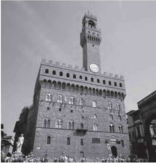
شكل ١-١: قصر فيكيو بفلورنسا، حيث عمل مكيافيلي في الهيئة الاستشارية الدبلوماسية الثانية من عام ١٤٩٨ إلى عام ١٥١٢.

طبيعة الحياة العامة في إيطاليا. تميّز الإنسانون في المقام الأول بالتزامهم بنظرية خاصة تتمحور حول المكونات الصحيحة للتعليم «الإنساني الحقيقي». كانوا يطلبون من طلابهم أن يبدؤوا بإجادة اللغة اللاتينية، ثم ينتقلوا إلى ممارسة الخطابة ومحاكاة أرفع الكُتّاب الكلاسيكيين شأنًا، ثم يكملوا دراساتهم بقراءة وافية للتاريخ القديم والفلسفة الأخلاقية. وقد أشاعوا أيضًا الاعتقاد الراسخ بأن هذا النوع من التدريب يشكّل أفضل تأهيل للحياة السياسية. كما دأب شيشرون على التأكيد مرارًا على أن هذه التخصصات تعزّز القيم التي نحتاج إلى اكتسابها في المقام الأول من أجل أن نخدم بلادنا جيدًا، والتي تتمثل في الاستعداد لإعلاء الصالح العام على مصالحنا الخاصة، والرغبة في محاربة الفساد والاستبداد، والتطلّع لبلوغ أنبل هدفين على الإطلاق؛ الشرف والمجد لبلادنا ولأنفسنا أيضًا.