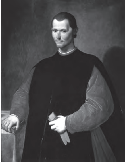
شكل ١-٣: لوحة تصوّر مكيافيللي بريشة سانتي دي تيتو في قصر فيكيو بفلورنسا.

على مدى فترة طويلة بما فيه الكفاية لتحقيق العظمة المدنية؟ حل هذه المعضلة هو ما تركّز عليه بقية «المطارات».