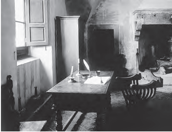
شكل ٤-١: مكتب مكيافيلي في بيته في «سانت أندريا» في ضاحية بيركوسينا بجنوب فلورنسا، حيث أُلّف كتاب «الأمير» عام ١٥١٣.

أن يتمثل في التفكّر في الماضي على نحو «مفيد» و«نافع» (٤:١-٣). وفي كتاب «حرب كاتيلين» توصل إلى الاستدلال على أن النهج الصحيح يجب، تبعاً لذلك، أن يتضمن «اختيار الأجزاء» التي تبدو «جديرة بأن تُسجّل»، وعدم محاولة تقديم سرد كامل لما وقع من أحداث (٤:٢).