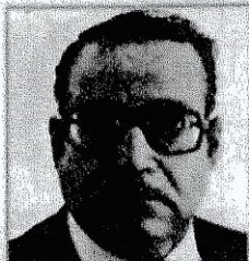
د. حسن حنفي