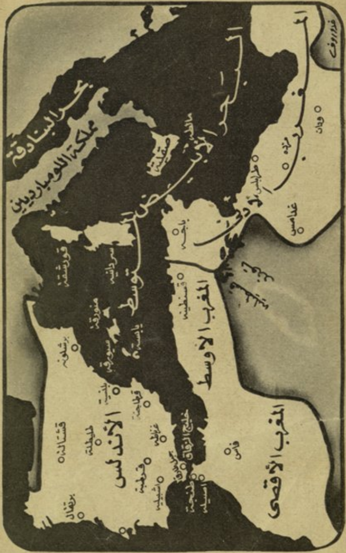
خريطة بلاد المغرب والأندلس في عهد الفتوحات الإسلامية